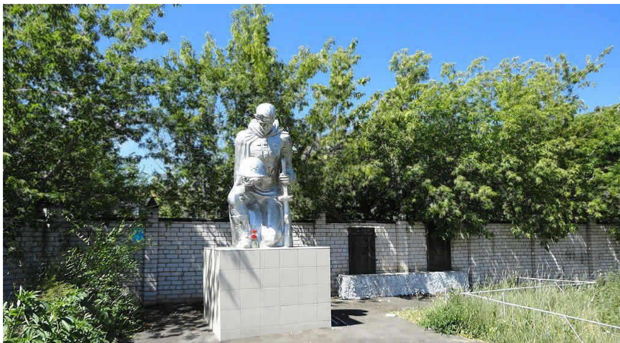
Улица Спортивная, памятник солдату