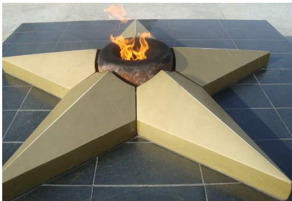
У Вечного огня