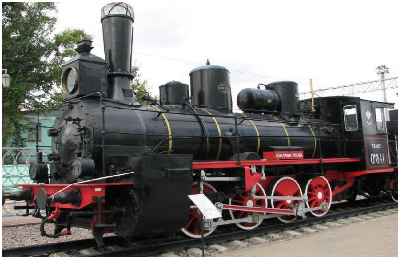
Улица Октябрьская, памятник «Паровоз»