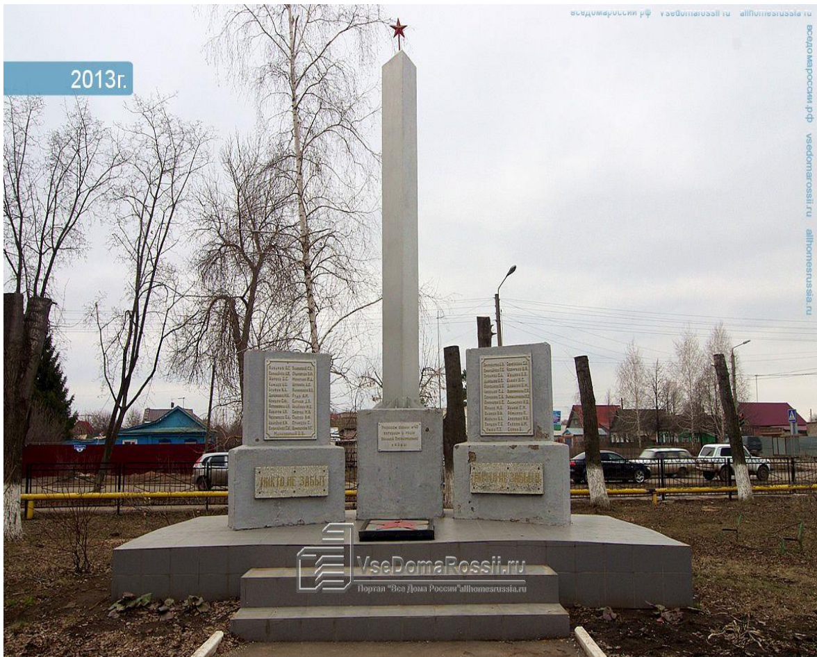
Улица 50 лет Октября, памятник ученикам школы №46, погибшим в годы Великой Отечественной войны