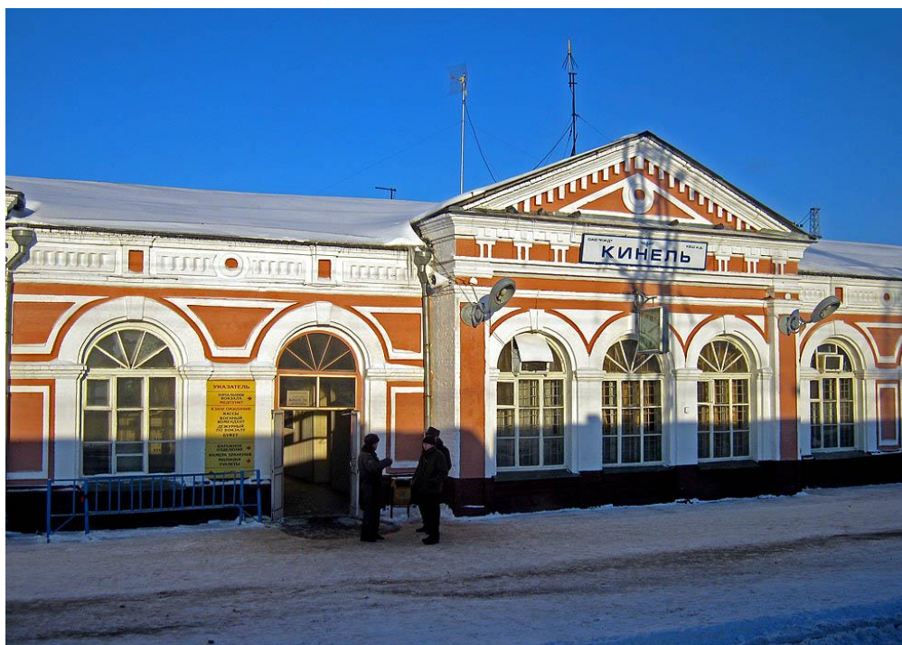
Памятник архитектуры - ЖД вокзал станции Кинель, улица Октябрьская, 50А